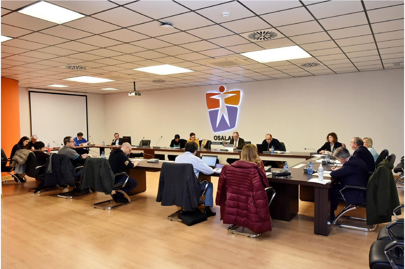
Reunión del Consejo General de Osalan presidido por Jon Azkue, Viceconsejo de Trabajo y Seguridad Social del Gobierno Vasco.