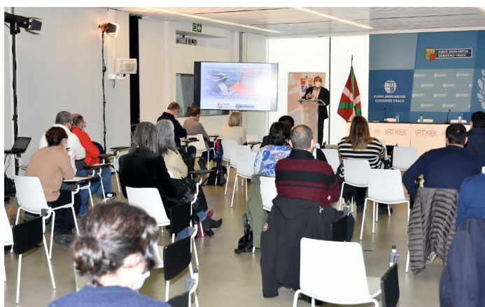
Primer taller dirigido al personal técnico de los Servicios de Prevención: Gestión de la PRL (Bilbao, 30 de noviembre de 2021)