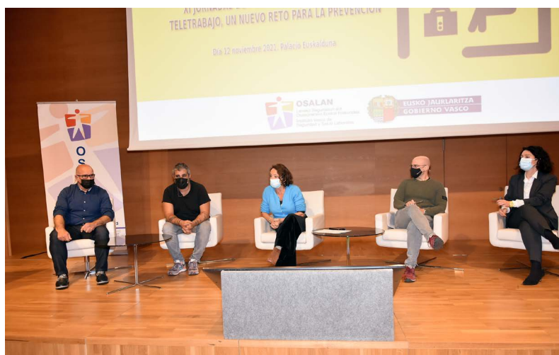
XI Jornadas de psicología laboral: Teletrabajo, nuevos retos para la PRL (Bilbao, 12 de noviembre de 2021)